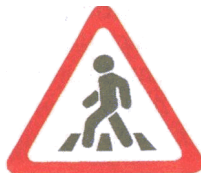
1.22. «Пешеходный переход»

Знак 1.22 (треугольный с красной каймой) относится к группе