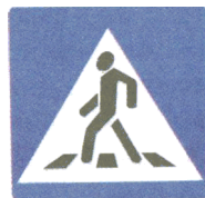
5.19.1. «Пешеходный переход»

предупреждающих знаков и предупреждает водителя, что впереди — знак 5.19.1. и пешеходный переход. А знак 5.19.1 (квадратный синий), имеющий то же название, относится к группе знаков особых предписаний и указывает пешеходам, что через дорогу необходимо переходить именно здесь.