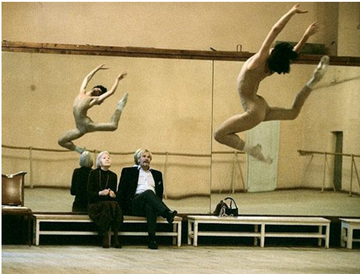
Репетиционный зал: Галина Уланова, Владимир Васильев и Николай Цискаридзе